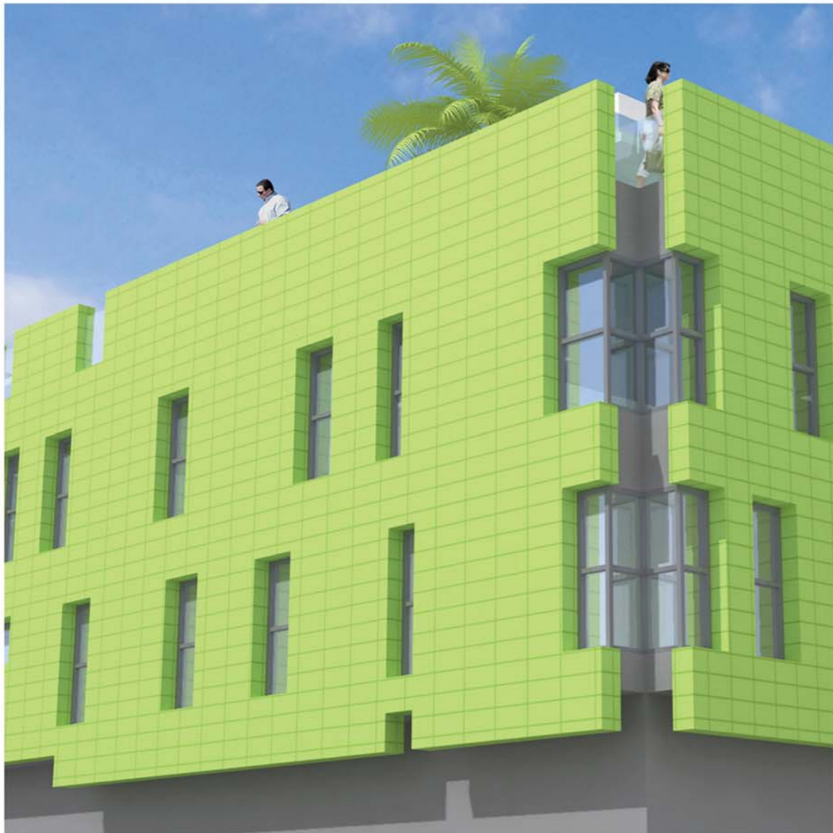
C/ Colombia, 5 - TOTANA